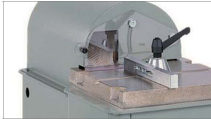
Protezione disco 01