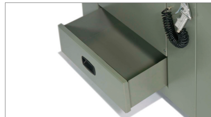
Raccolta trucioli 02